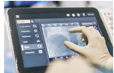
Philips Azurion: Innovative Bildgebungslösung