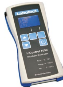
InControl 1050 Labotect GmbH