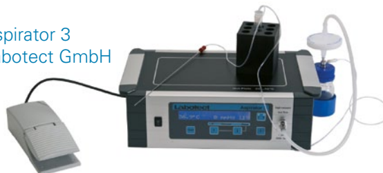
Aspirator 3 Labotect GmbH