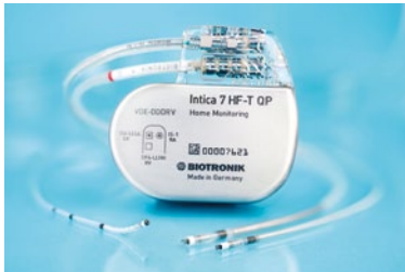
Neues CRTD Implantat Intica 7 HF-T QP von Biotronik