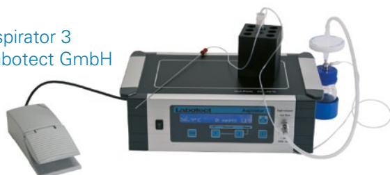
Aspirator 3 Labotect GmbH