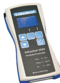
InControl 1050 Labotect GmbH