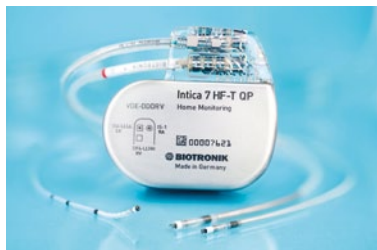
Neues CRTD Implantat Intica 7 HF-T QP von Biotronik