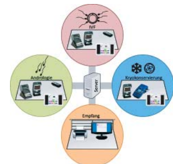
OCTAX Ferti Proof-Konzept MTG Medical Technology Vertriebs-GmbH