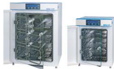
C200 und C60 CO 2 -Inkubatoren Labotect GmbH