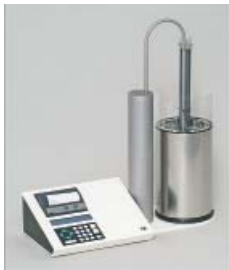
CTE2200-Einfriersystem MTG Medical Technology Vertriebs-GmbH

Besuchen Sie unsere Rubrik Medizintechnik-Produkte