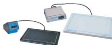
Hot Plate 062 und Hot Plate A3 Labotect GmbH