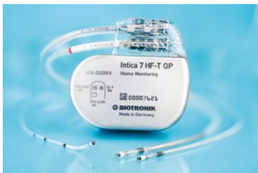
Neues CRTD Implantat Intica 7 HF-T QP von Biotronik