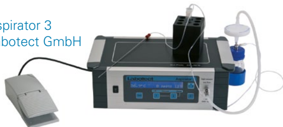
Aspirator 3 Labotect GmbH