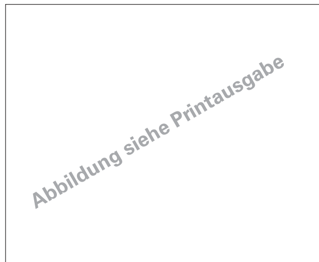
Abbildung 1: Hepatozelluläre und cholangiozelluläre Transportproteine mit Relevanz für die Gallensteinpathogenese. Unkonjugiertes Bilirubin wird durch die UDP-Glukuronyltransferase (UGT1A1) glukuronidiert und das konjugierte Bilirubin durch den „ATP-binding cassette transporter MRP2“ (kodiert durch ABCC2) in die Galle sezerniert. Die hepatischen Transporter für Phospholipide, Gallensalze und Cholesterin sind MDR3 (ABCB4), BSEP (ABCB11) und ABCG5/ABCG8 (ABCG5/ABCG8). Die Gallenzusammensetzung wird durch CFTR (ABCC7) modifiziert. Mod. nach [4].

Die Bildung von Cholesteringallensteinen wird im Wesentlichen durch 3 Faktoren bestimmt: die Übersättigung der Gallenblasengalle mit Cholesterin, Cholesterinkristallisation in einem Muzingel und eine Gallenblasenhypomotilität. Das Verhältnis von Cholesterinkonzentration zu Gallensalz- und Phospholipidkonzentration bestimmt dabei die Lithogenität der Galle. Bei der lithogenen Galle ist das Verhältnis zugunsten des Cholesterins verschoben, sodass die Gallensalze und Phospholipide das wasserunlösliche Cholesterin nicht vollständig in Mizellen in Lösung halten können [11]. Eine Cholesterinübersättigung kann durch die Hemmung des Gallensalztransporters BSEP durch Einnahme von bestimmten Immunsuppressiva (Tacrolimus, Ciclosporin) oder aufgrund einer Cholesterinhypersekretion infolge einer Schwangerschaft oder einer Fastenperiode entstehen [12, 13]. Über die Sekretion von Muzin durch die Gallenblasenepithelzellen wird die Präzipitation von Cholesterinmonohydratkristallen begünstigt, welche sich bei zusätzlicher Kontraktionsstörung der Gallenblase zu Gallensteinen zusammenlagern können (Abb. 2). Die Gallenblasenhypomotilität wird durch die toxische Wirkung des Cholesterins auf die Muskelschicht der Gallenblasenwand angenommen. Den gleichen Effekt einer gestörten Gallenblasenentleerung können eine fettarme Ernährung und die Therapie mit bestimmten Medikamenten haben, die über eine verminderte Freisetzung von Cholezystokinin eine Gal-