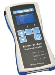
InControl 1050 Labotect GmbH