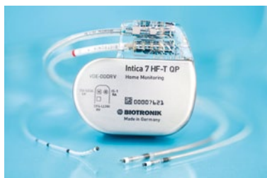
Neues CRTD Implantat Intica 7 HF-T QP von Biotronik