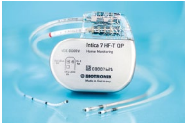
Neues CRTD Implantat Intica 7 HF-T QP von Biotronik