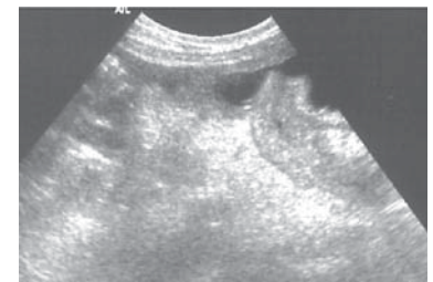
Terminales Ileum und Valvula ileo-coecalis