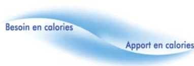
Figure 1 : Gestion de l'apport calorique avec ProtiLine® Balance ; But : stabilisation à long terme et avec plaisir du poids de „bien-être » atteint

Substituer régulièrement ou de temps en temps un repas principal avec le substitut de repas ProtiLine® Balance permet le maintien en « balance » du bilan énergétique/calorique quotidien ou hebdomadaire. Gérer son apport calorique avec plaisir permet de stabiliser son poids de « bien-être » à long terme.