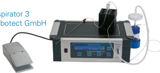
Aspirator 3 Labotect GmbH