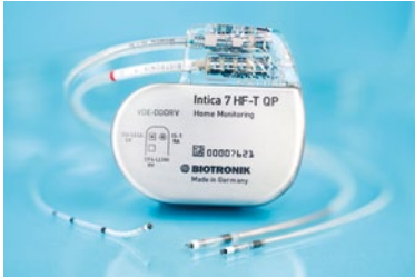
Neues CRTD Implantat Intica 7 HF-T QP von Biotronik