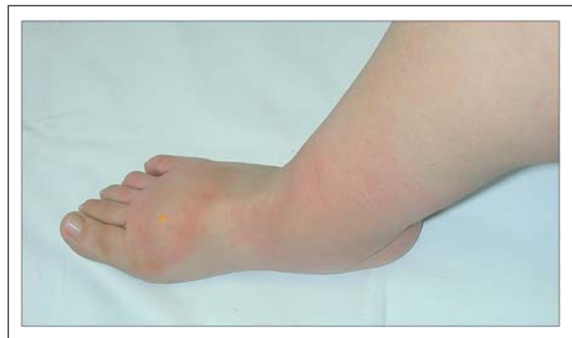
Abbildung 3: Am Fußrücken einer Patientin mit einem primärem Lymphödem ist die Injektionsstelle des FITC-Dextrans als gelbe runde Quaddel für 1–2 Tage noch gut erkennbar.

stoff Fluoreszein Isothiocyanate-dextran (FITC-Dextran) gebunden ist, subepidermal gespritzt (Abb. 3). Die Hautlymphgefäße nehmen den Farbstoff auf und werden so unter dem Fluoreszenz-Auflichtmikroskop in vivo sichtbar. Normalerweise wird der Farbstoff sofort über tiefer gelegene Lymphkolektoren abtransportiert und es kommt deshalb nur zur Anfärbung von einigen wenigen Maschen des oberflächlichen Netzes (Abb. 4a). Bei Patienten mit Lymphödem, bei denen der Abtransport der Lymphe vermindert ist, kommt es zur Ausdehnung des Farbstoffes im oberflächlichen Netzwerk (Abb. 4b), welches als eine Art Überlaufbecken arbeitet [20]. Beim Lymphödem Typ Nonne-Milroy stellen sich an der betroffenen Extremität keine initialen Lymphgefäße dar [21, 22].