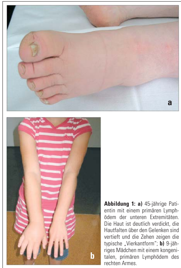
Abbildung 1: a) 45-jährige Patientin mit einem primären Lymphödem der unteren Extremitäten. Die Haut ist deutlich verdickt, die Hautfalten über den Gelenken sind vertieft und die Zehen zeigen die typische „Vierkantform“; b) 9-jähriges Mädchen mit einem kongenitalen, primären Lymphödem des rechten Armes.