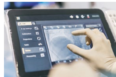
Philips Azurion: Innovative Bildgebungslösung