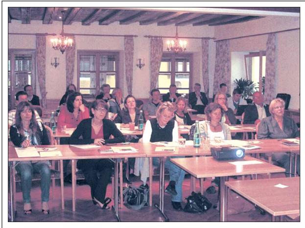
Abbildung 1: Sommerakademie der ÖGH in Traunkirchen

An weiteren Veranstaltungen der ÖGH stehen die gemeinsame Jahrestagung zusammen mit der ÖGN am 2. und 3.