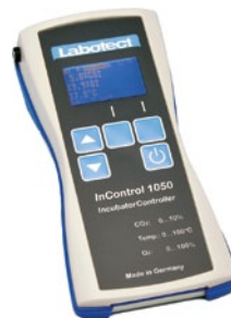
InControl 1050 Labotect GmbH