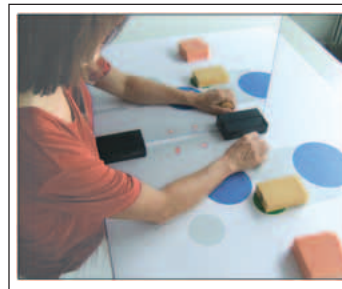
Abbildung 1: Spiegeltraining: Die Betrachtung der Bewegung der rechten Hand im Spiegel suggeriert eine Bewegung der linken Hand.

Die Spiegeltherapie (ST) wurde erstmals von Ramachandran et al. bei Phantomschmerz nach Gliedamputationen beschrieben [1] und im weiteren Verlauf bei Schlaganfallpatienten in einer Fallstudie angewendet [2]. Eine Dekade später werden nun vermehrt klinisch randomisierte kontrollierte Studien durchgeführt, nachdem zunächst Einzelfallstudien zum Effekt der ST nach einem Schlaganfall, nach Tumorentfernung, nach peripherer Nervenläsion oder komplexem regionalem Schmerzsyndrom veröffentlicht wurden. Hierbei wird ein