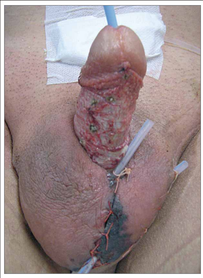
Abbildung 1: Erster postoperativer Tag