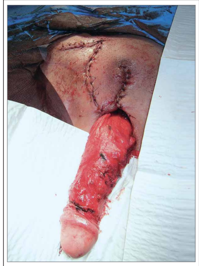
Abbildung 3: Primäre Schwenklappenplastik und Meshgraftdeckung des Penischaftes