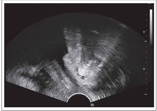
Abbildung 3: Wichtig zur Beurteilung der TVT-Position: Kontrolle in der zweiten Ebene (Sagittalschnitt)